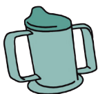
Beker met drinktuit