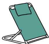
Ruggensteun (om te kunnen zitten in bed)